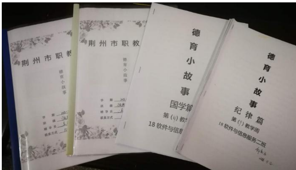
自编德育小故事教材