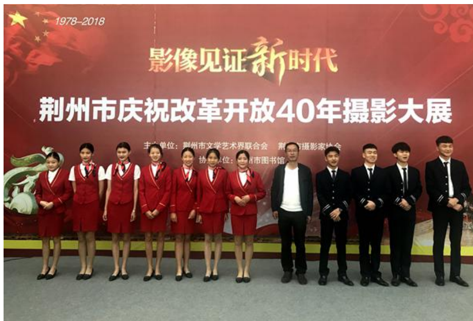
组织学生参加“荆州市庆祝改革开放 40 周年摄影大展”志愿者活动

2017-2018 学年，学校社团蓬勃发展。多样化的社团，成为学生平衡学习、展现自我、培养才艺、多位发展的平台。广大学生在走近社团、参与和支持活动的过程中，在全员参与中，培养学生的集体荣誉感、竞争意识与合作意识，实现知识的交流、技艺的切磋、思想的碰撞、感情的激荡，获得新信息、新经验、新知识、新思想，达到提高自身综合素质的效果。学校有读书会、演讲与口才协会、电子竞技协会、晨曦志愿服务队、书法协会、动漫社等 10 个社团。学校关心学生在校的生活质量，全力打造良好的校园环境，最大程度满足学生在校学习生活的各方面需求，以提供更好的服务质量。