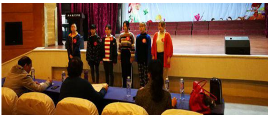
组织学生参加北京京西宾馆招聘会