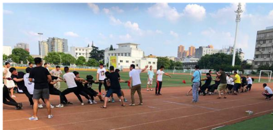
荆州市职教中心开展拔河比赛活动