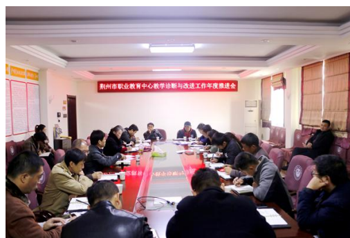
我校召开教学诊断与改进工作年度推进会

会上，田校长提出，荆州市职业教育中心教学诊断与改进工作年度推进会是一个诸葛会，需要大家集思广益，以整改的思想，从学校、专业、课程、教师、学生 5 个层面，按照 8 字螺旋方针，通过对照数据、找问题、找原因、找对策以