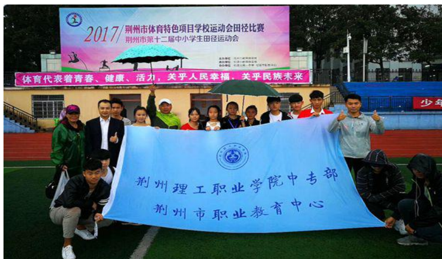
组织学生参加荆州市第十二届中小学生田径运动会