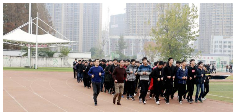
组织学生参加“晨练+”活动情况