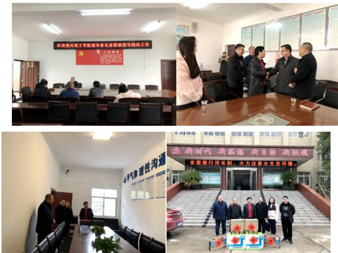
走访毛家港镇开展综治调研帮扶共建工作