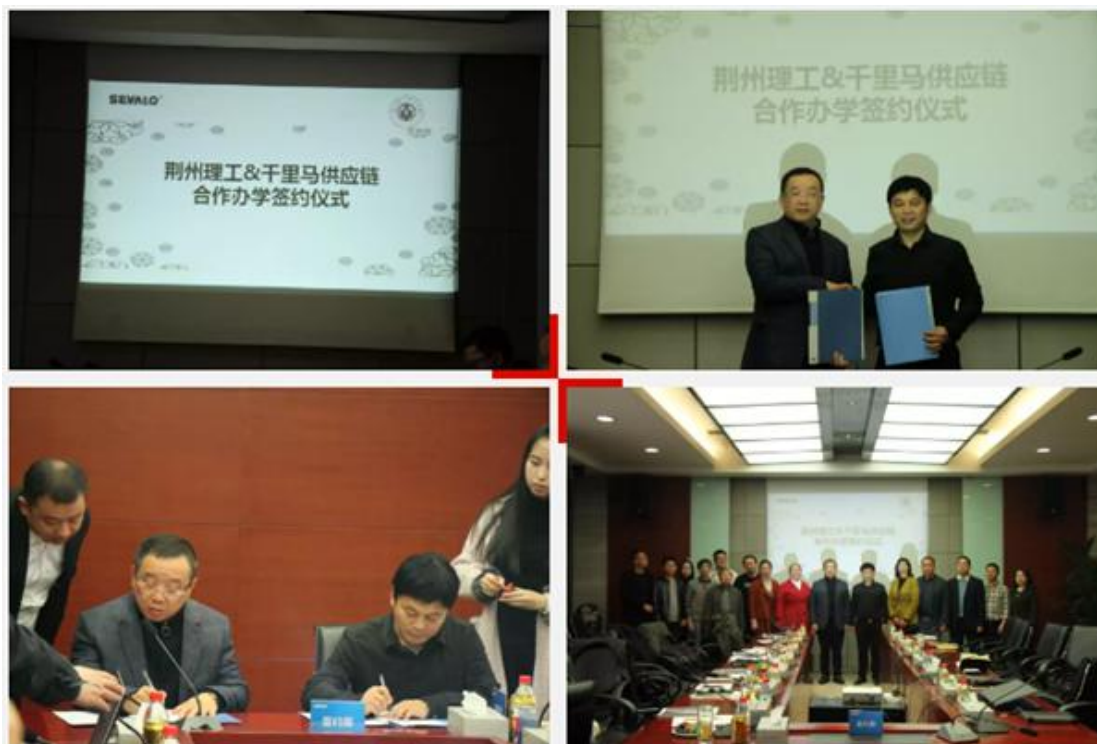
我校与千里马机械供应链股份有限公司举行校企合作签约仪式