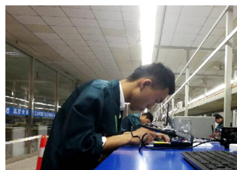
我校承办荆州市第十一届电子产品装配与调试赛项情况