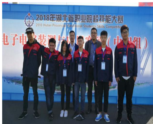
我校学生参加全省电子电路装调与应用赛项