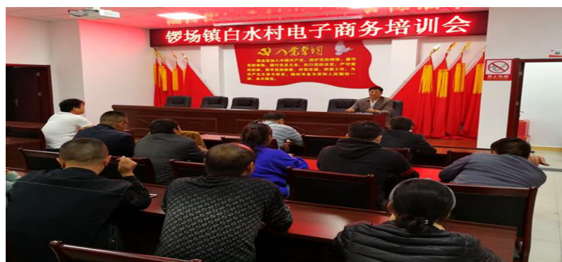
扶贫驻点村“扶智” 电子商务培训

通过学习与交流，白水村30多名村民深受启发，纷纷表示为规避风险增长了知识，为脱贫致富学到了一技之长。