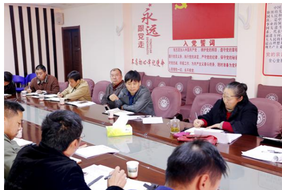
我校召开教学诊断与改进工作年度推进会