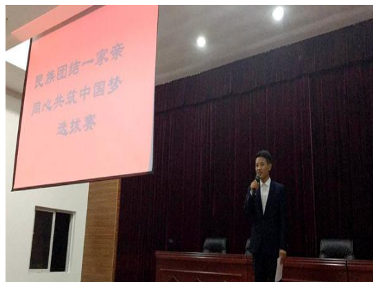
“民族团结一家亲，同心共筑中国梦”主题演讲比赛