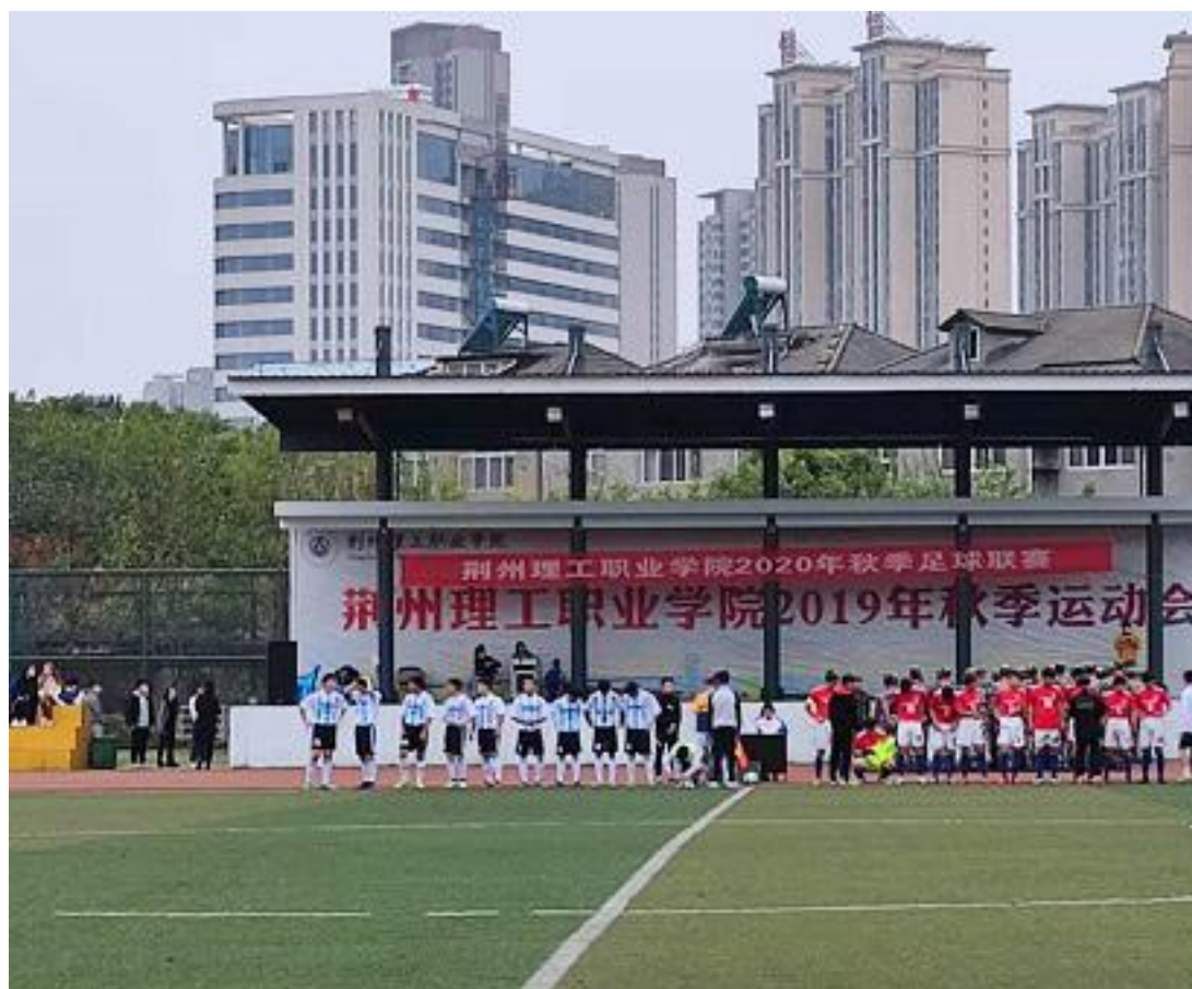
举办校园足球联赛

学校以丰富多彩、健康向上的校园文化活动为抓手，积极组织学生参与各项有益活动。本年度学校举办了“非物质文化遗产之荆楚凤崇拜与凤舟文化”讲座、“校园足球联赛”、“欢乐涂鸦，美化校园”、“共筑创新梦想，点亮创业未来”创新创业大赛；“展现自我才能，塑造精彩人生”模拟招聘会；“红色电影”展播；校园文化艺术节；国防班结业入伍典礼等主题突出、特色鲜明、形式多样的校园文化活动，展现了学校发展风采，凸显了校园文化特色，这些活动都已经成为学生关心关注、热情参与的集体活动，极大地丰富了学生的校园生活，营造了培养学生综合素质的良好氛围，春风化雨，润物无声。