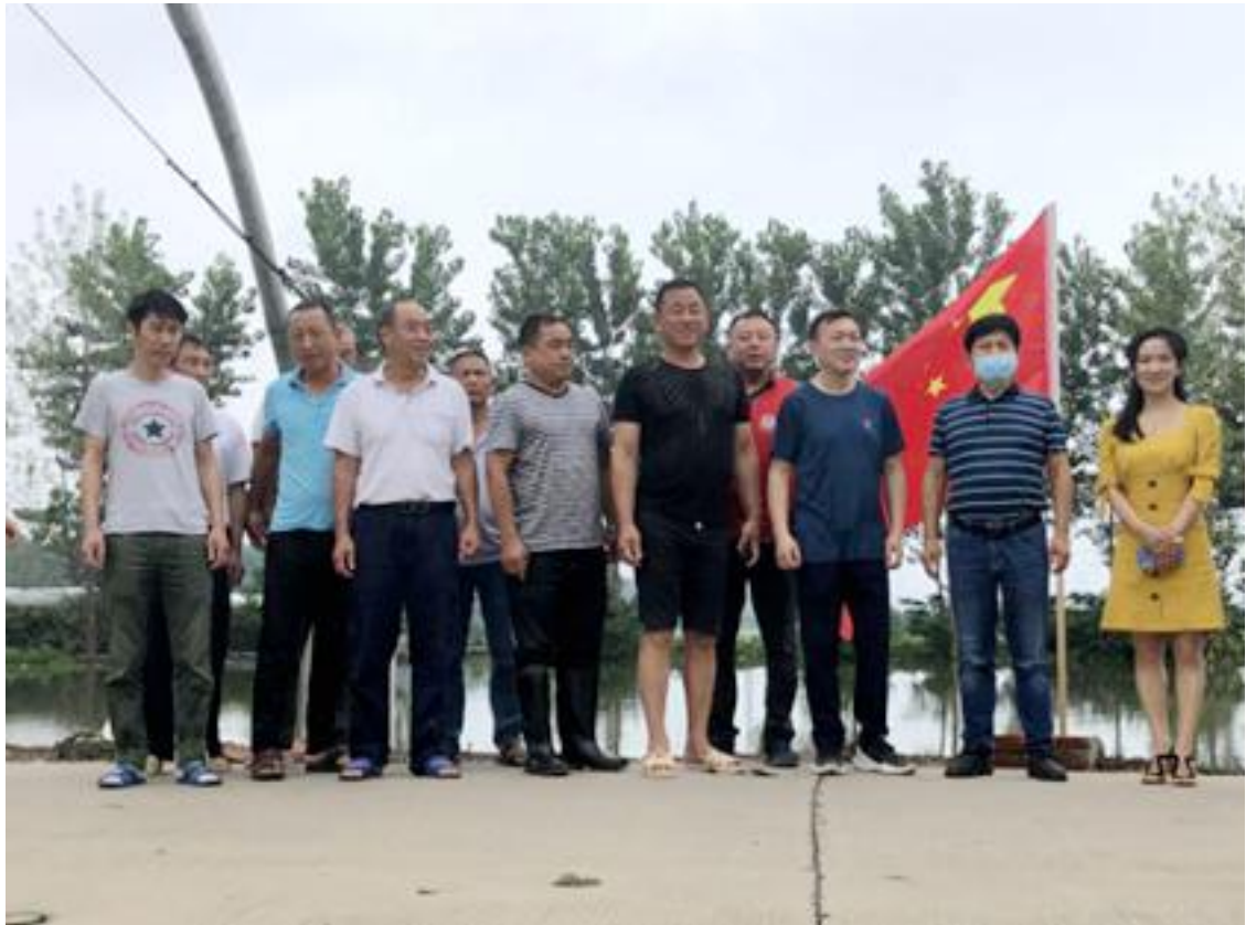
荆州市职业教育中心主要领导到沙市区锣场镇白水村调研脱贫攻坚和防汛工作